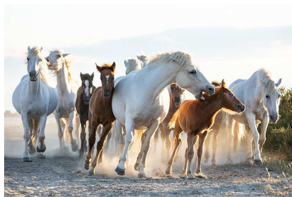
Avec les poulains