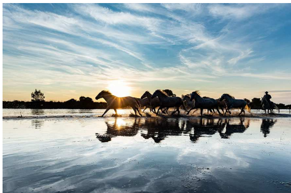
Dans les marais