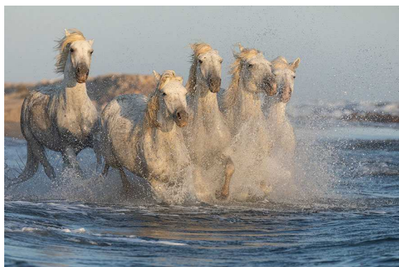
A la plage

A noter : pour garantir une taille du groupe réduite (nombre de véhicules à garer, rapidité de déplacement du groupe sur place pour changer de point de vue,...), je n'accepte plus les accompagnants non photographes en plus du groupe. Si vous souhaitez participer à la séance, même sans prendre de photo, vous devez acheter votre place. Merci pour votre compréhension.